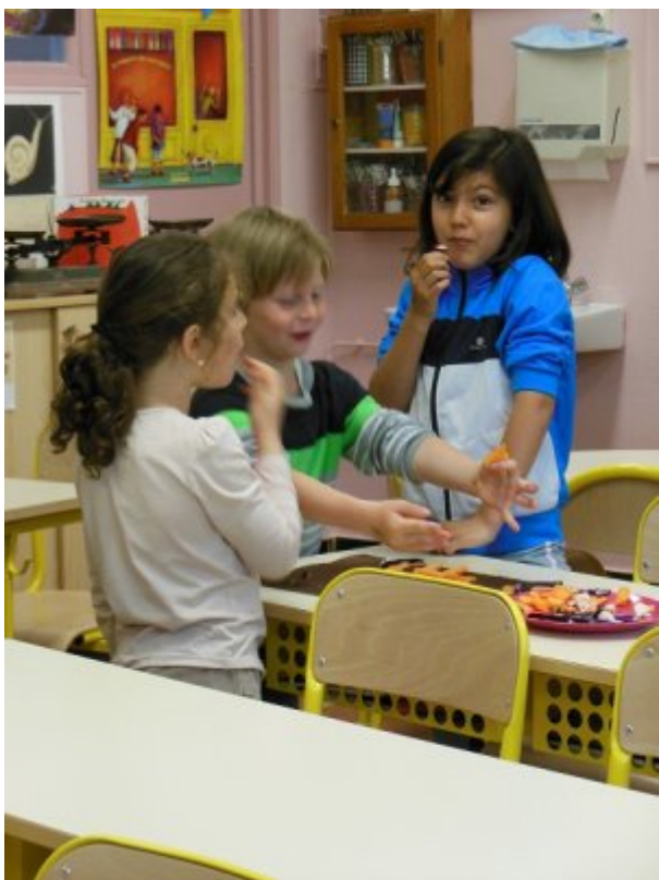
Dans les autres ateliers :